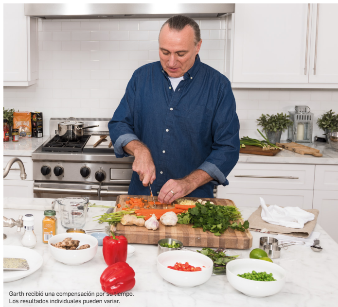
Garth recibió una compensación por su tiempo. Los resultados individuales pueden variar.

Los efectos secundarios más frecuentes de COSENTYX incluyen: síntomas de resfriado, diarrea e infecciones de las vías respiratorias superiores.