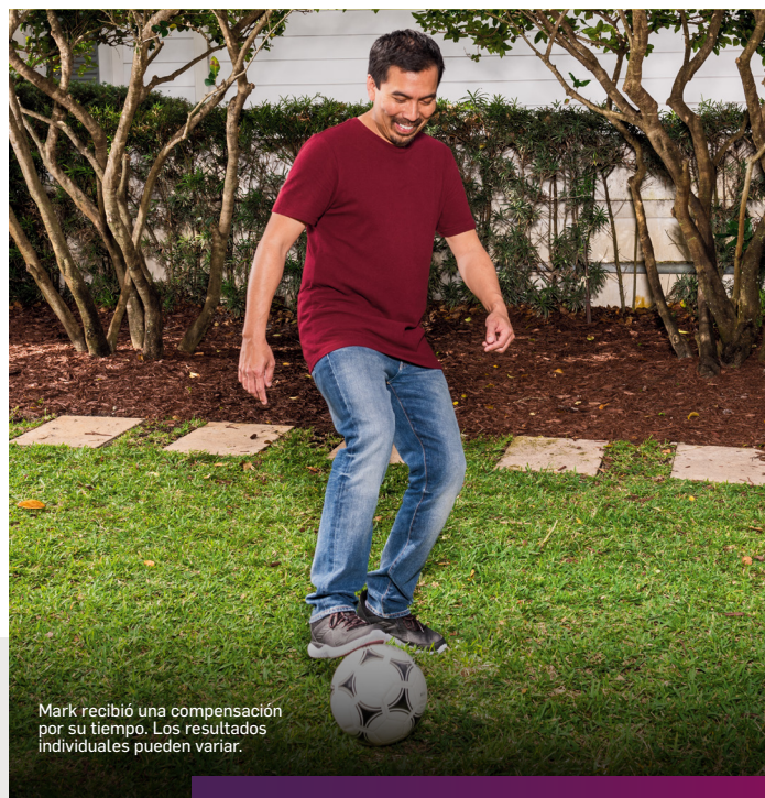
Mark recibió una compensación por su tiempo. Los resultados individuales pueden variar.

El doble de personas tratadas con COSENTYX lograron una mejoría de al menos el 20 % en los síntomas generales en tan solo 16 semanas .§ Muchos siguieron sintiendo alivio a los 5 años .†