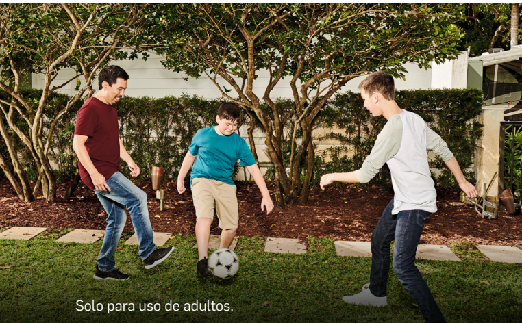
Solo para uso de adultos.