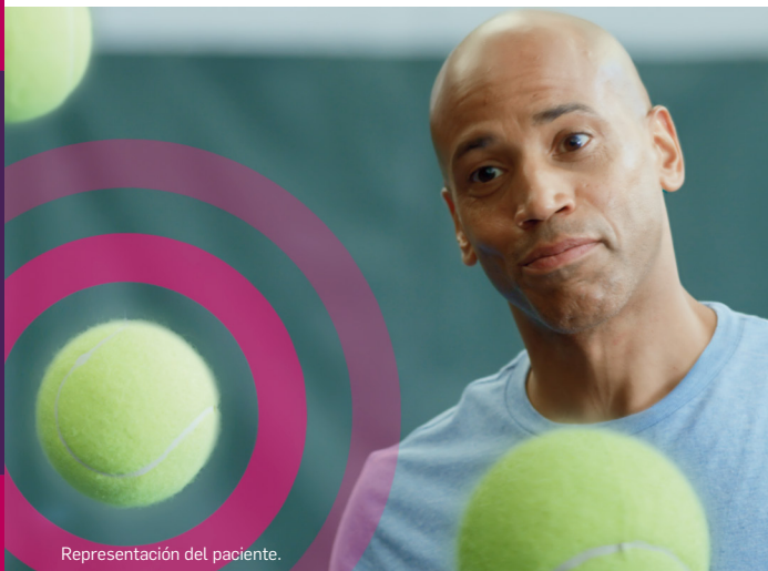
Representación del paciente.

Visite COSENTYX.com para obtener más información.